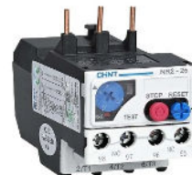
Relé de Sobrecarga