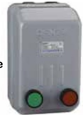
Arrancador de Motores